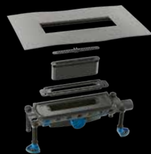
Dallmer CeraFloor Select, Edelstahl matt

Das weiterentwickelte Ablaufgehäuse ist mit einer Vielzahl passender Duschrinnen kombinierbar. Auf Basis von praxisnahem Feedback wurde DallFlex 2.0 konzipiert. Neue, durchdachte Features ergänzen die bewährten Stärken des Systems und machen es zu einer nächsten Generation der Entwässerung.