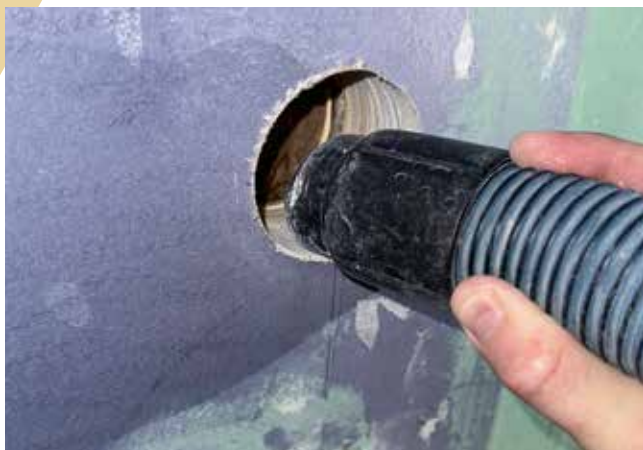
Reinigen und absaugen / Pulire e aspirare

arbeiten liegt darin, dass der Bauherrschaft ein grösseres Zeitfenster für die endgültige Festlegung der Position von Garnituren, Gleitstangen oder Duschtrennwänden zur Verfügung steht.