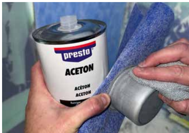
Entfetten / Sgrassare