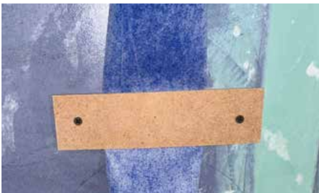
Fixbox fixieren / Fissare la Fixbox