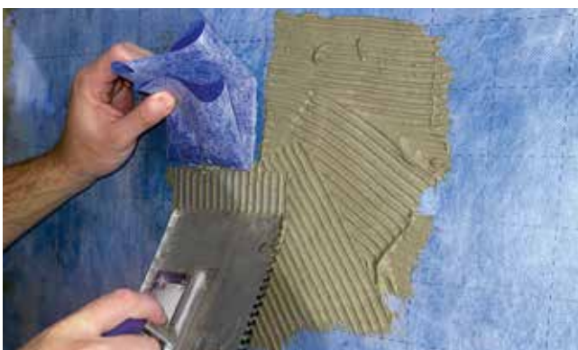
Dichtvlies in die Abdichtung einarbeiten. / Inserire il tessuto di rinforzo nell'impermeabilizzazione.

tende Dübel von Herstellern – sind gemäss SIA 271/1, Ziffer 0.4, die Vorgaben für Abweichungen zu beachten. Abweichungen von der Norm sind grundsätzlich zulässig, wenn sie durch Theorie und/oder Versuche ausreichend begründet werden oder wenn neue Entwicklungen und Erkenntnisse dies rechtfertigen. Sie sind in der Nutzungsvereinbarung sowie in den Bauwerksakten nachvollziehbar darzulegen und mit einer nachvollziehbaren Begründung zu dokumentieren. Der Bauherr ist über die gewählte Sonderlösung zu informieren und hat abschliessend darüber zu befinden. Der Unternehmer, welcher die Bohrungen ausführt, ist zudem verpflichtet, einen Leistungsnachweis über die Eignung der Massnahme einzufordern und diesen gegenüber dem Auftraggeber offenzulegen.