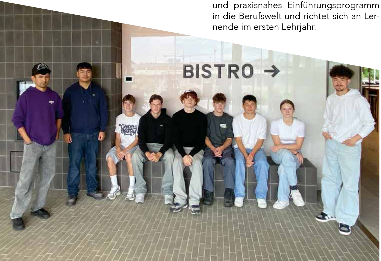
Die Lernenden, die am Basiskurs 2025 teilnahmen, im Foyer des Bildungsparks in Dagmersellen.

Vom 3. bis 14. August 2026 führt Ceruniq erneut den Basiskurs für Lernende durch. Der Kurs bietet ein abwechslungsreiches und praxisnahes Einführungsprogramm in die Berufswelt und richtet sich an Lernende im ersten Lehrjahr.