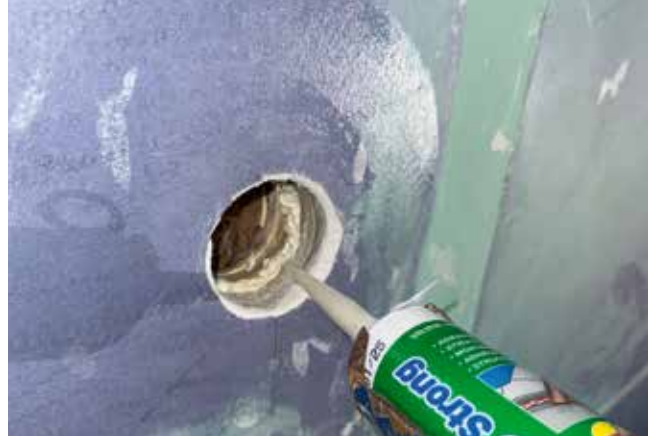
Klebstoff im Bohrloch auftragen/ Applicare la colla nel foro