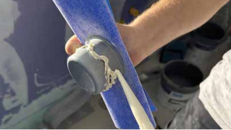
Klebstoff auf der Aussenseite der Fixbox anbringen/ Applicare la colla sulla Fixbox